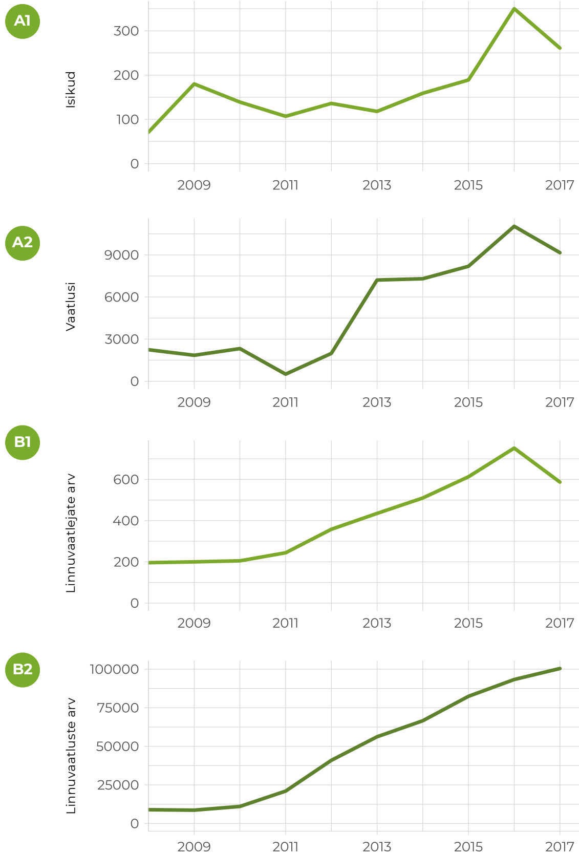
Joonis 3.4.4. Riikliku loodusvaatluste andmebaasi üldine kasutamine (A1, A2) ja Tartu Ülikooli loodusemuuseumi PlutoF andmebaasi kasutamine linnuvaatlajate poolt (B1, B2) 9 aasta jooksul